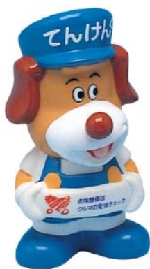
てんけんくん貯金箱