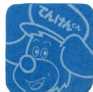
てんけんくんハンドタオル